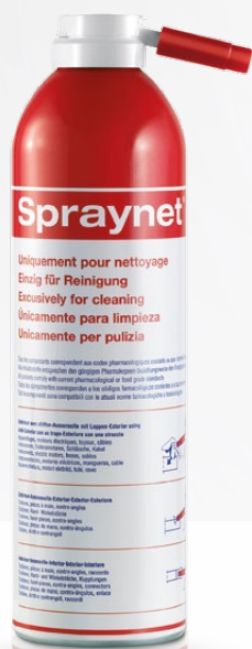
SPRAYNET 500 ml čistící sprej REF. 1600036-001